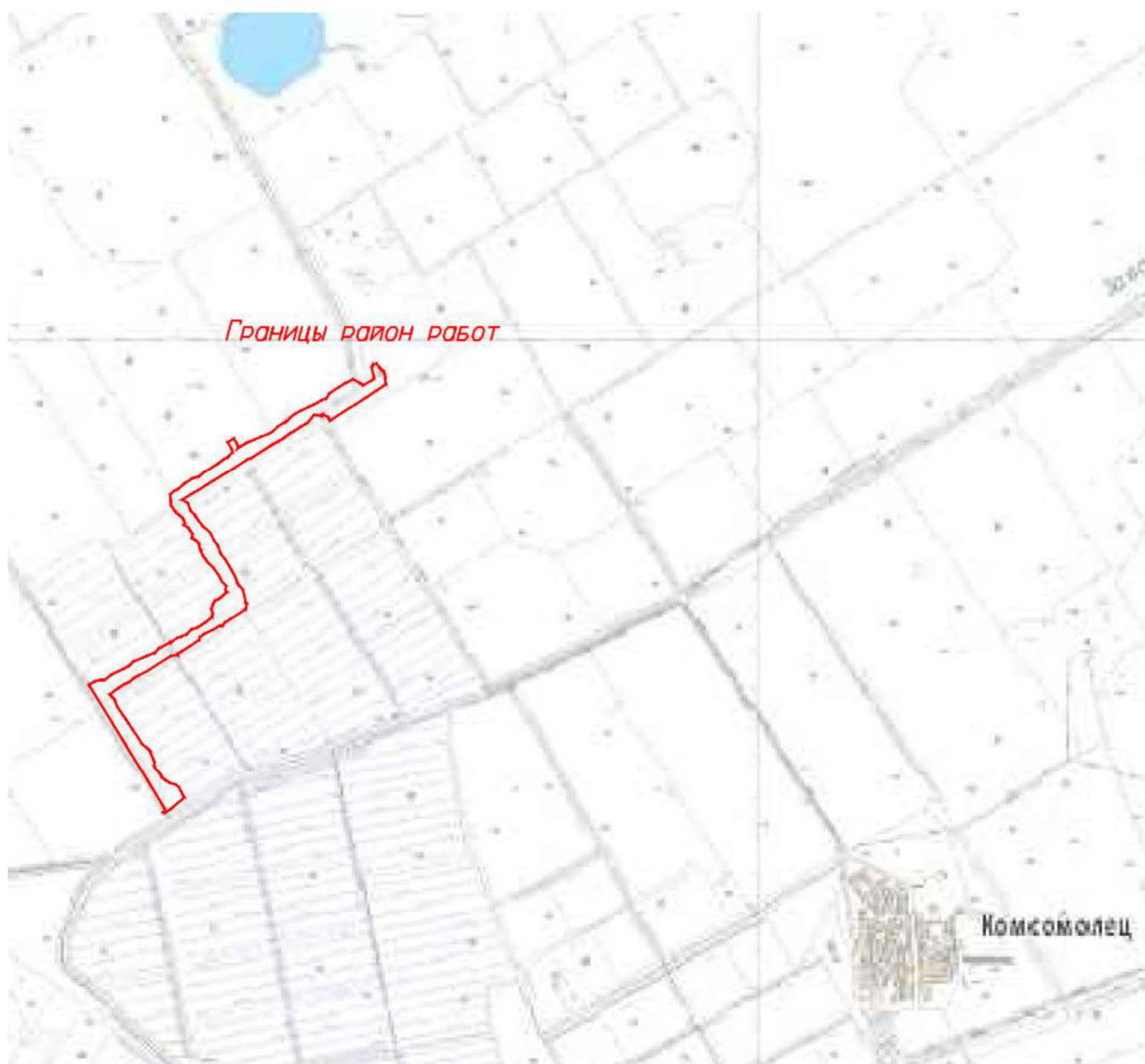
Рисунок 1.1 – Обзорная схема района работ