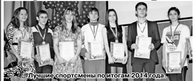
Лучшие спортсмены по итогам 2014 года.