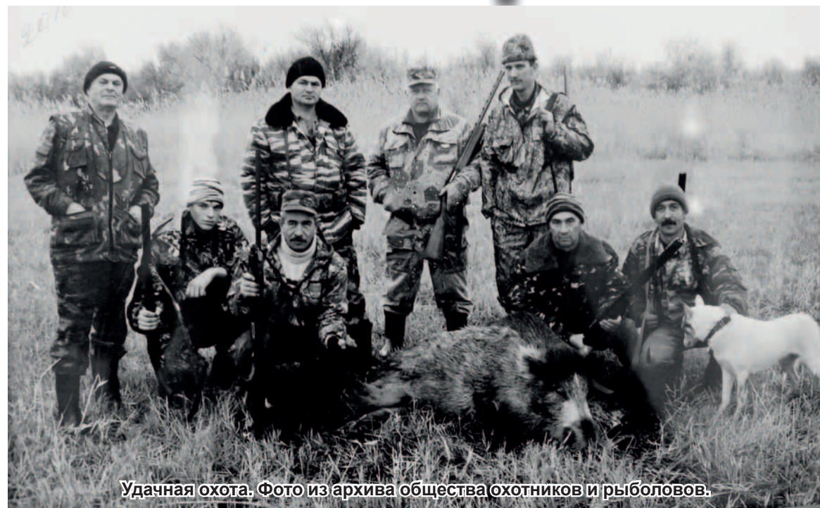
Удачная охота.

дарственный охотничий билет и получает разрешение в то хозяйство, где желает поохотиться.