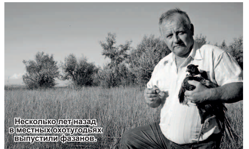
Несколько лет назад в местных охотугодьях выпустили фазанов.

- Учитывая нынешнюю ситуацию с распространением таких болезней, как африканская чума сви-