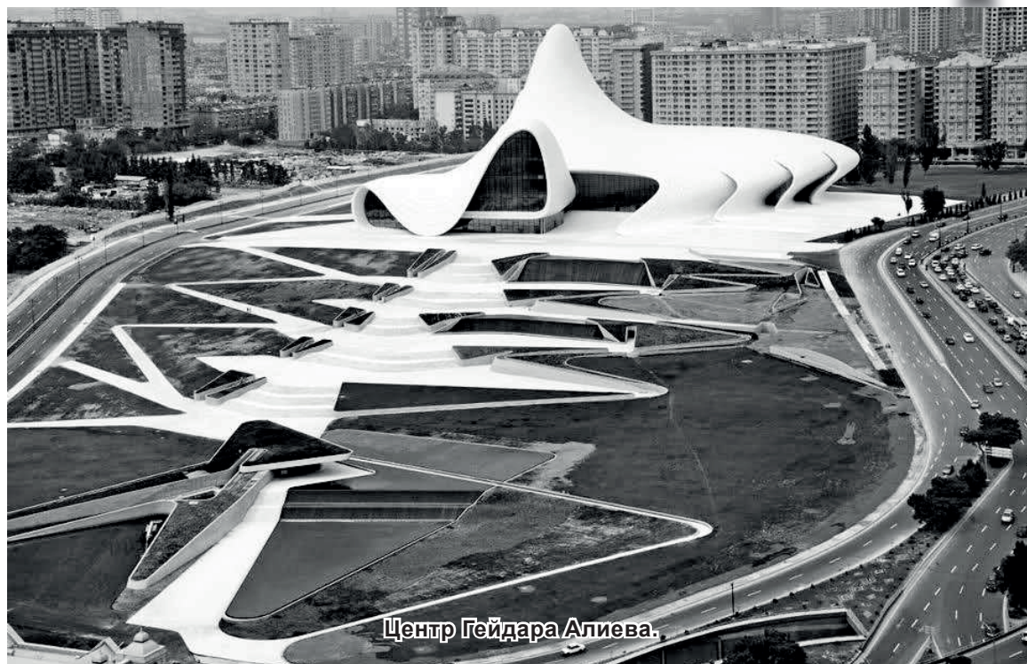
Центр Гейдара Алиева.

от первого удара бомб нефть взорвется и загорится. Этот огонь остановить было нельзя. Город немцам нужен был неповрежденным.