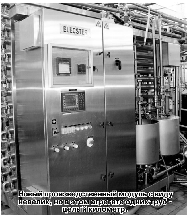
Новый производственный модуль с виду невелик, но в этом агрегате одних труб – целый километр.

- Мы произвели несколько пробных партий сыра «Ма-