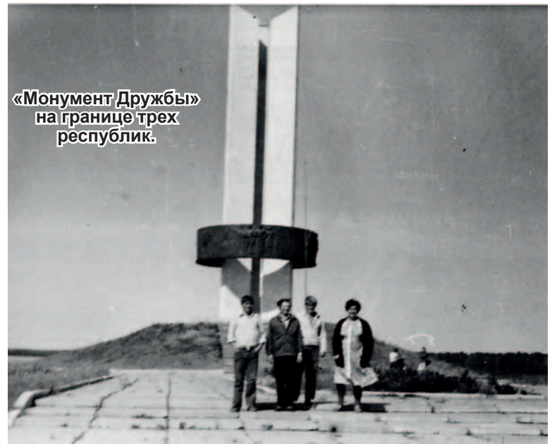
«Монумент Дружбы» на границе трех республик.

Сердце рвется от слез, Но помочь ты не можешь семье. В землю намертво врос, Как солдат на прошедшей войне. Ты не кричишь: «Помоги!» - Нет у тебя больше сил. Лес и поле – враги, Твое счастье Чернобыль спалил. Если дрогнет земля, То все люди стремятся помочь.