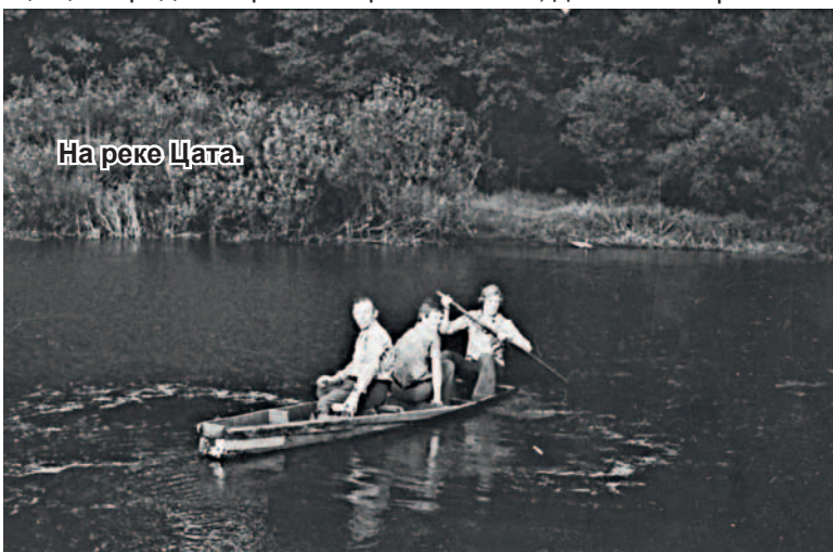
На реке Цата.

На слуху город Шостка Черниговской области. Здесь располагался химкомбинат «Свема» по выпуску фотопленки. Я увлеклся фотографией со школьных лет, сначала был у меня пленочный фотоаппарат «Смена», потом «ФЭД-2». Фотопленку приобретал