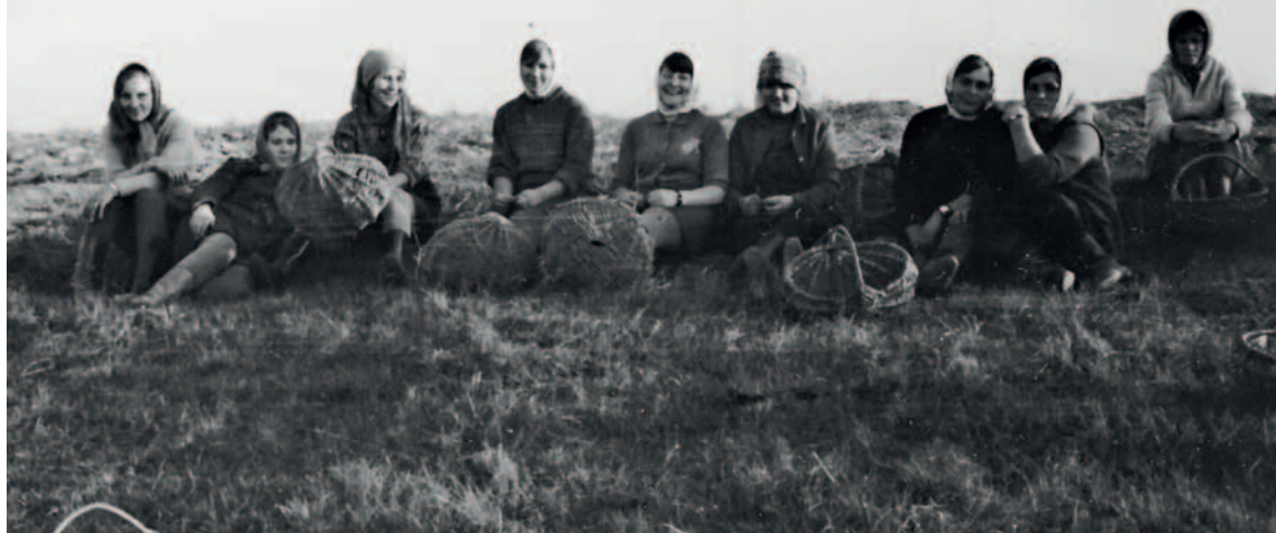
Ученики из школ трех республик на уборке картофеля. Поле возле «Монумента Дружбы».

их здоровье. Но основную тяжесть вынесли на себе славянские народы: украинцы – 356617 человек, русские – 300000 человек, белорусы – 126800 человек. Всего в трех странах – 783417 человек.