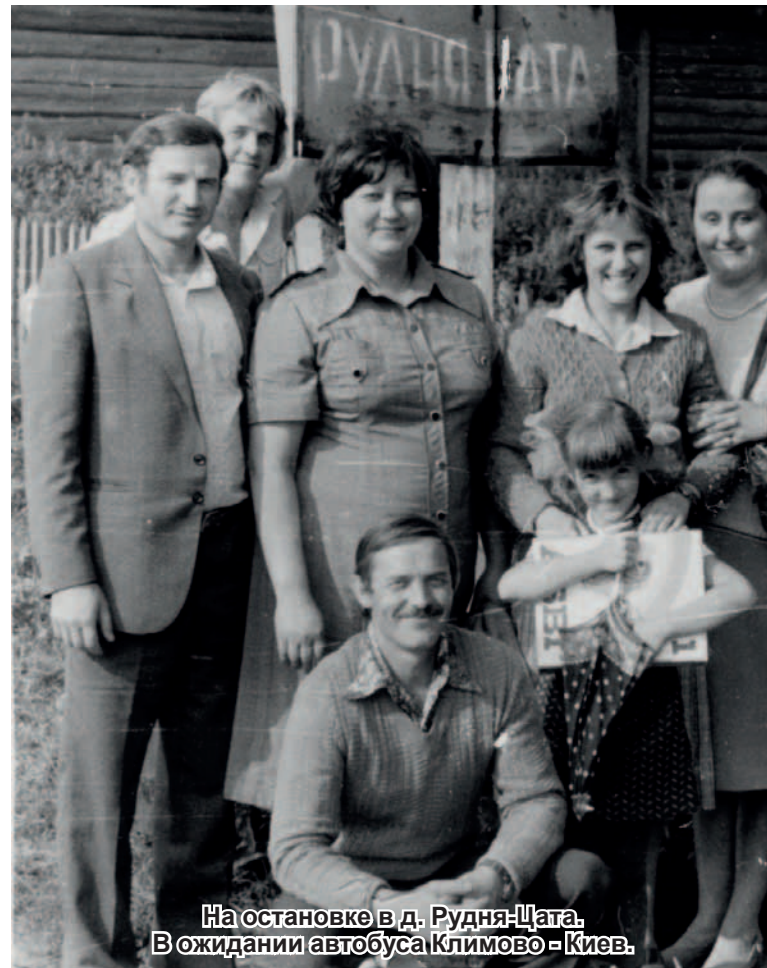
На остановке в д. Рудня-Цата. В ожидании автобуса Климово - Киев.

Память, говорят, - хлеб души. Душа со временем наполняется тем, что перечувствовал, пережил. А он редко был сладок, этот хлеб у моих сверстников, детство и отрочество