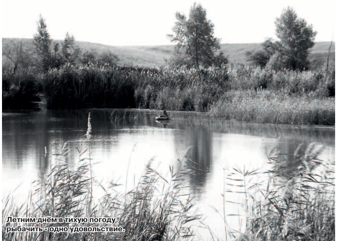
Летним днём в тихую погоду рыбачить – одно удовольствие.

ный восторг от диких тюльпанов. После сельскохозяйственного бума советских лет, когда поля распахивались почти до самых берегов заливов, они снова возвращают себе просторы. За поселком Заволжский Бережновского поселения (в прошлом второе отделение колхоза им. Калинина) тянутся неоглядные россыпи тюльпанов. Цветы стоят неделю-две в конце апреля. В холодную весну, как нынешняя, доживают до майских праздников. Снимки сделаны мною 30 апреля в хвосте ерика Широкий (в народе его называют Красивый), фото в цвете можно посмотреть на нашем сайте.