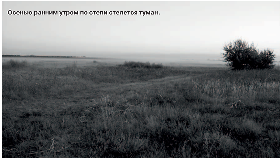
Осенью ранним утром по степи стелется туман.

ченной эрозии. Но и здесь пора бить тревогу. Из-за резкого сокращения орошаемых площадей, отсутствия должного ухода и планомерного обновления лесополосы постепенно стареют и умирают. Не нужно далеко ходить, уже на выезде из Николаевска на трассу за постом ГИБДД – бурелом. Засохшие и подгнившие деревья просто падают друг на друга. Свою долю в разорение степного края вносят и предприимчивые браконьеры, что выпиливают целые массивы и продают для отопления теплиц овощеводам.