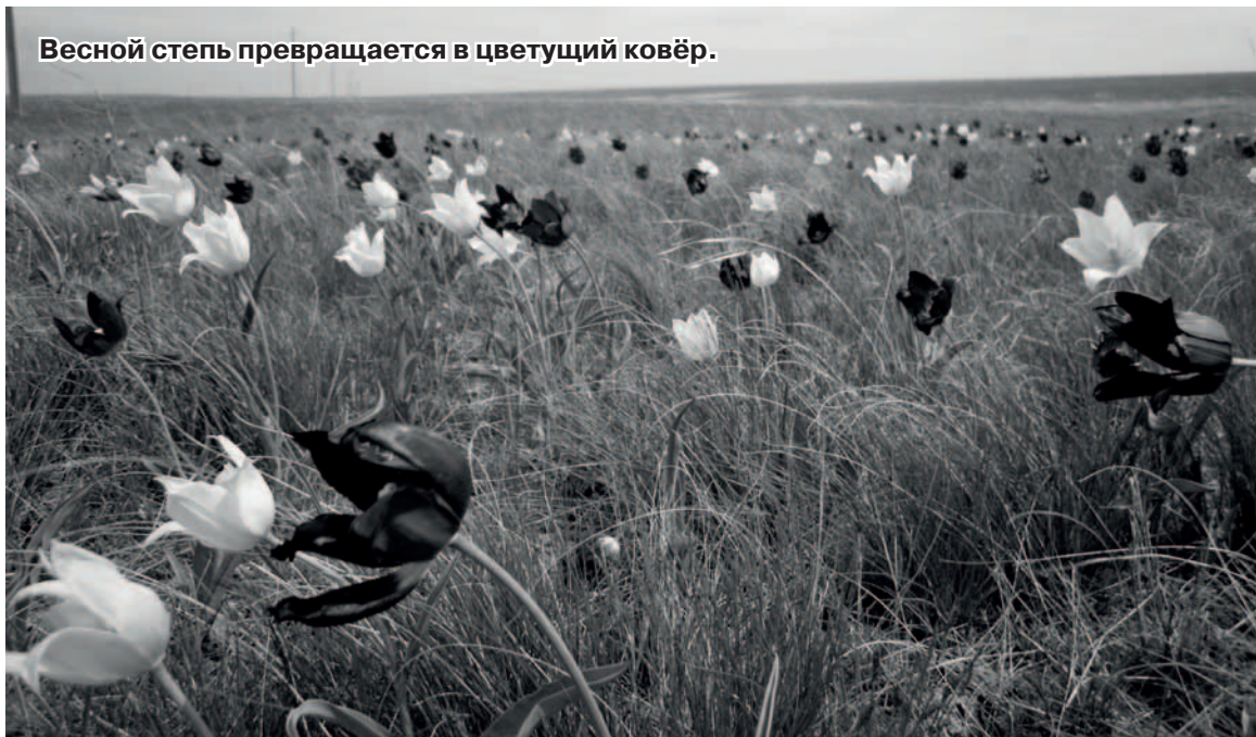
Весной степь превращается в цветущий ковёр.

Впрочем, некоторыми плодами окультуривания степи мы пользуемся по сей день. Многие километры защитных лесополос, высаженных в годы буйного расцвета мелиорации, продолжают защищать нас от суховея, пыльных бурь и по-