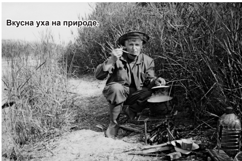
Вкусна уха на природе.

- Конечно. Последний пример... Весной я прямо на Волге напротив Николаевска в районе бывшей станции заправки газовых баллонов вытащил на простую удочку у камышей толстолобика на 5 кг. Просто вышел, как говорится, душу отвести,