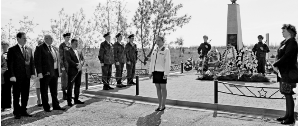
Митинг у нового памятника на старой Николаевке.

ториях, а также подрядные организации, которые выполняют работы по реализации проекта благоустройства центральной части Николаевска.