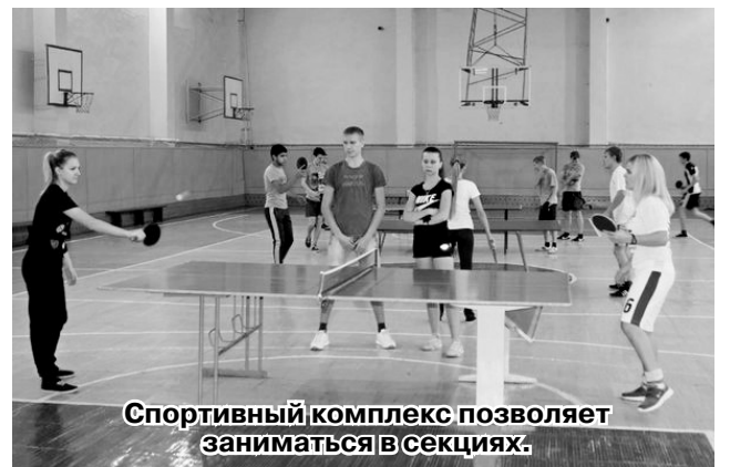
Спортивный комплекс позволяет заниматься в секциях.