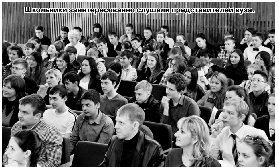
Школьники заинтересованно слушали представителей вуза.

За 20 лет своего существования институт подготовил