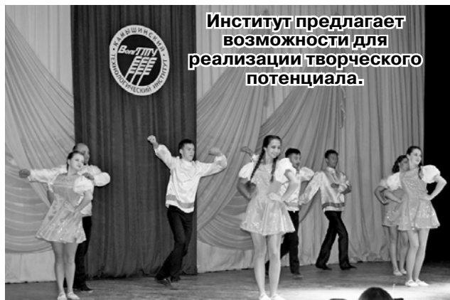
Институт предлагает возможности для реализации творческого потенциала.