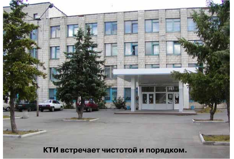
КТИ встречает чистотой и порядком.

Существуют в институте и дополнительные образовательные программы, а имен-