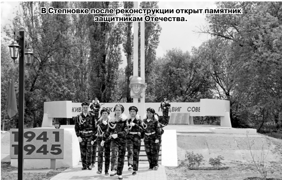
В Степновке после реконструкции открыт памятник защитникам Отечества.