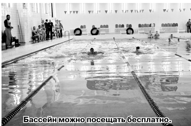
Бассейн можно посещать бесплатно.